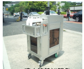
清水建設(株)開発 特許出願中