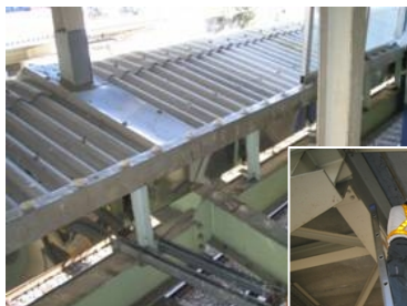
J R 茅野駅

J Rのホームなどで採用になり高い評価を得ている鳥類忌避剤を設置 (カップ、専用レールの設置後、充填等) していきます。直射日光、風雨に曝される現場でも1年から3年の高い忌避効果を発揮します。